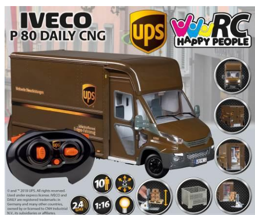
A cikk ábrája

Meghatalmazott Happy People GmbH & Co. KG Konsul-Smidt-Str 8b 28217 Bremen GERMANY