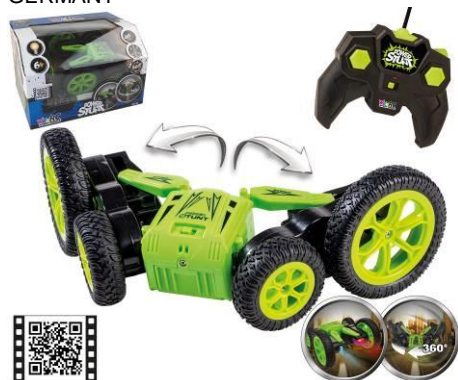
Illustrasjon av artikkelen

Fullmektig Happy People GmbH & Co. KG Speicher I, Konsul-Smidt-Str. 8b 28217 Bremen GERMANY