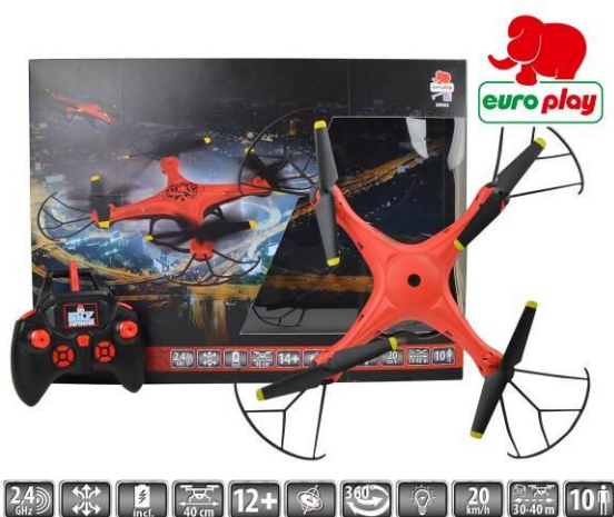
Ilustracja przedstawiająca produkt

Pełnomocnik Happy People GmbH & Co. KG Konsul-Smidt-Str 8b 28217 Bremen GERMANY