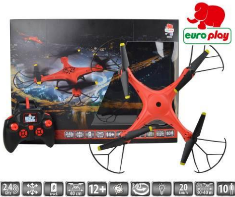
Abbildung des Artikels

Bevollmächtigter Happy People GmbH & Co. KG Konsul-Smidt-Str 8b 28217 Bremen GERMANY