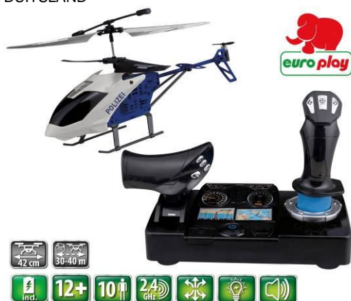
Afbeelding van het artikel

Gevolgmachtigde Happy People GmbH & Co. KG Konsul-Smidt-Str 8b 28217 Bremen DUITSLAND