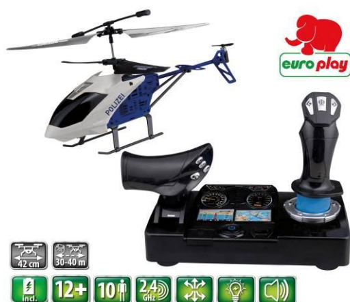
A cikk ábrája

Meghatalmazott Happy People GmbH & Co. KG Konsul-Smidt-Str 8b 28217 Bremen GERMANY